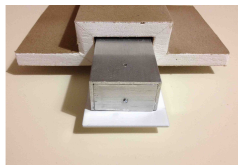
GK-Fertigteile für Brandschutzdecke F90

Zu Details informieren wir Sie gerne per mail oder Telefon, auf Wunsch beraten wir Sie auch vor Ort.